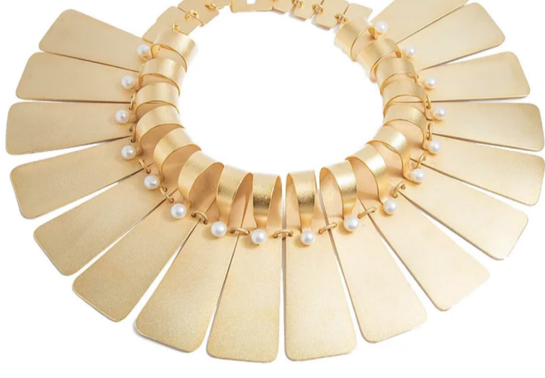
Collaborazione De Liguoro - Reem Jano Jewelry Piano-Piano

Il cuore riprende a battere normalmente, i volti si distendono, e inizia quel delizioso cicalaccio che contraddistingue questi eventi. Ci sono molte persone, e non è semplice distaccarsi tra loro, ma quando si riesce ad arrivare alle vetrine dove sono esposte le 350 opere di gioielleria contemporanea si viene travolti da tutto il potere meccanico che le caratterizza: metalli preziosi e nobili si alternano a quelli meno pregiati, sostenibili e raw. Tecniche artigianali si estendono a quelle meccaniche come il 3D. A enfatizzare quest'ultimo processo sono le opere in acciaio nero di Morphé London . Proseguendo il percorso ci si accorge di come nonostante le forti differenze, ciò che accomuna ogni oggetto è il suo essere tattile, materiale. Ne sono un esempio i gioielli realizzati in oro 18 carati e diamanti rovidi dell'israeliana Anna Ben Ruby Jewellery Design e le collane made in USA di Parme Marfn , tra le quali spicca il gioiello "Hedgehog II", in pelle e perline, per il quale sono state necessarie più di 300 ore di lavoro.