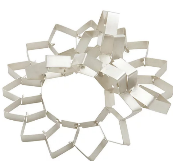
Anna Maria Pitt Jewellery Art Ltd Backbone

Il vernissage giunge al termine. C'è ancora chi vorrebbe parlare, abbeverarsi delle sensazioni che i gioielli trasmettono. Gli ospiti scendono le scale del maestoso palazzo milanese con la consapevolezza di aver vissuto una serata unica, interrotta solo dal passare del tempo.