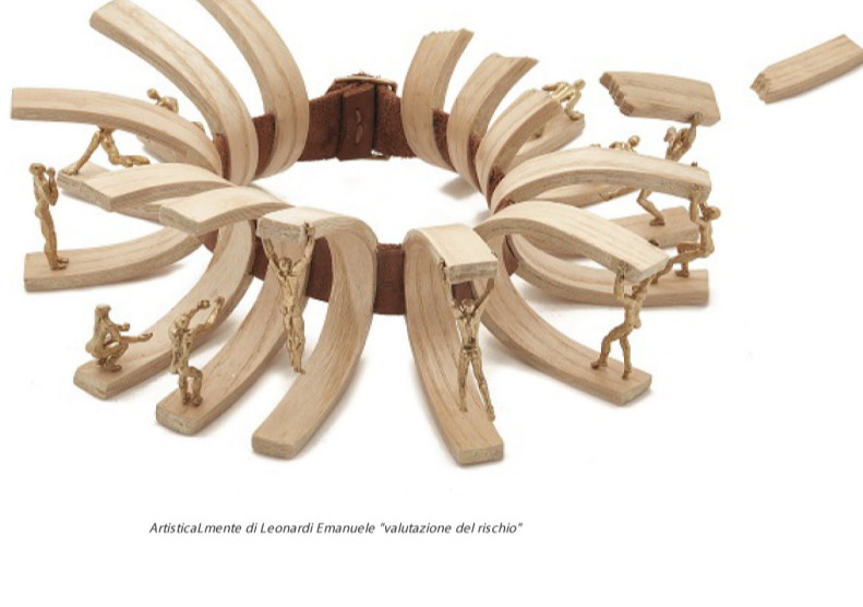
Artisticamente di Leonardi Emanuele "valutazione del rischio"